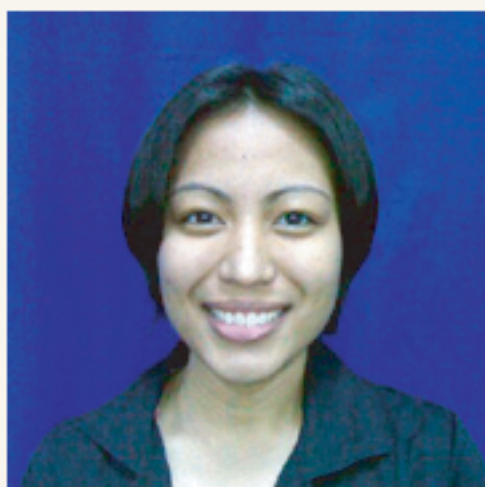
Stein先生のテキストを見る

フィリピンに現地子会社を設立し、教育水準の統一化をはかっています。そして、教師の資格保持者、もしくは外国人に英会話を教えた経験があるなどの人物に対し、講師となるための数段階の試験やトレーニングを実施して、ハイレベルな講師を確保しています。